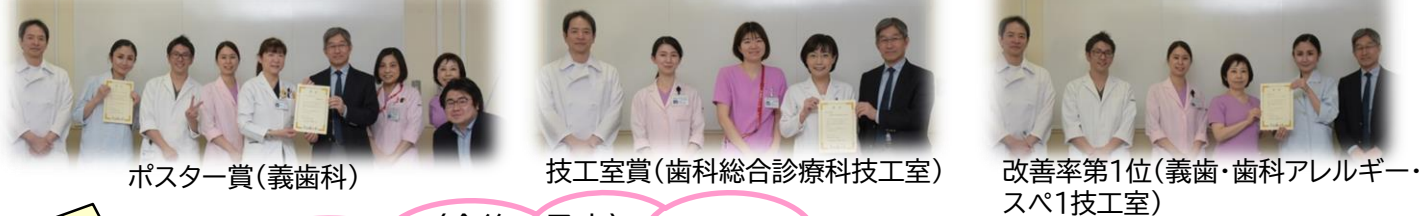
ポスター賞(義歯科)