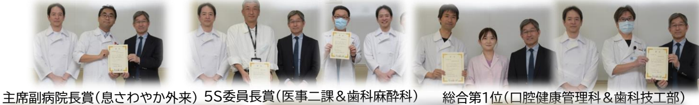
主席副病院長賞(息さわやか外来) 5S委員長賞(医事二課&歯科麻酔科) 総合第1位(口腔健康管理科&歯科技工部)